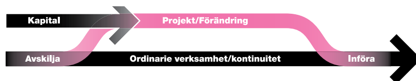
Figur 2: Projekt vs. ordinarie verksamhet (från Jensen & Trädgårdh 2012, s. 27).

Den teoretiska utgångspunkten för ett projekt, och här utgår vi från en modell från Jensen & Trädgårdh (2012), är att det är en från ordinarie verksamhet avskild insats vars resultat i slutändan ska föras tillbaka till den ordinarie strukturen.